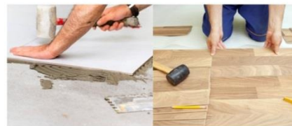
laminátpadlózás és melegburkolás.

Az elmúlt egy évben folytattam különböző igényeknek megfelelő lakó és nem lakó épületek padlózatának és falazatának hidegburkolása, valamint a nagy népszerűségnek örvendő