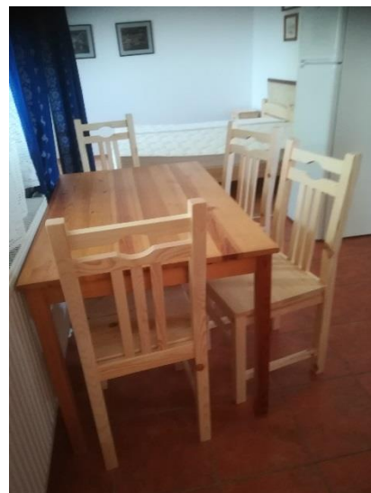
szék 7, szék 8, szék 9, szék 10