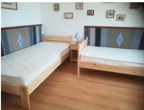
heverő 4, heverő 5, éjjeli szekrény 5