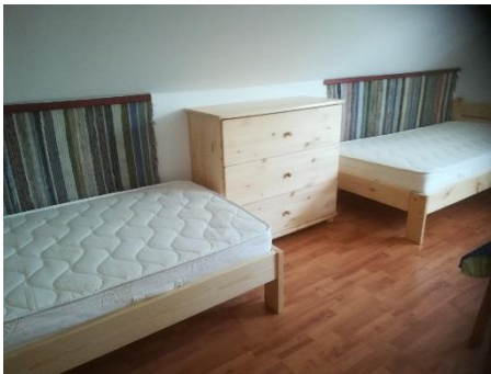
fiókos komód 4, heverő 1, heverő 2