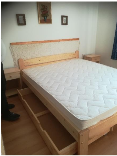
franciaágy 1, éjjeli szekrény 1, éjjeli szekrény 2