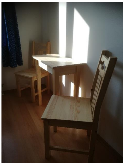
szék 1, szék 2, lerakóasztal 1

1978459852 azonosító számú, „Minőségfejlesztés a Bárándi Koroknai Portán” című projekt keretében beszerzett bútorzat fotódokumentáció