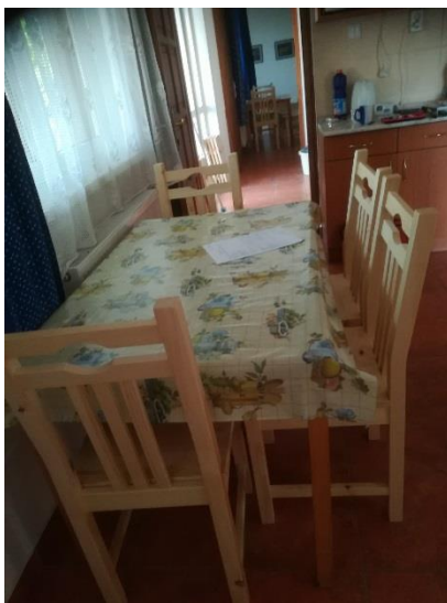
szék 3, szék 4, szék 5, szék 6