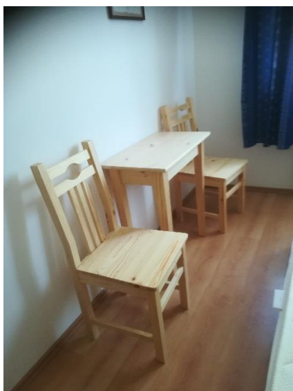
szék 11, szék 12, lerakóasztal 2