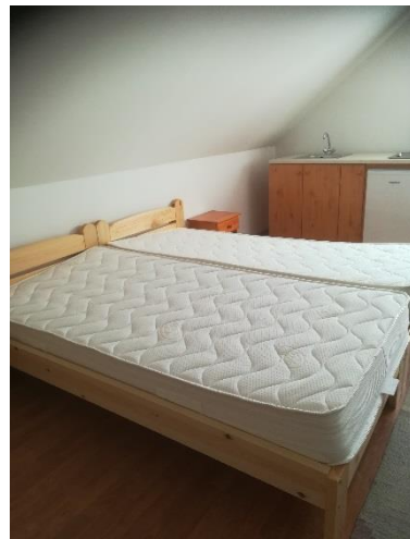
heverő 9, heverő 10