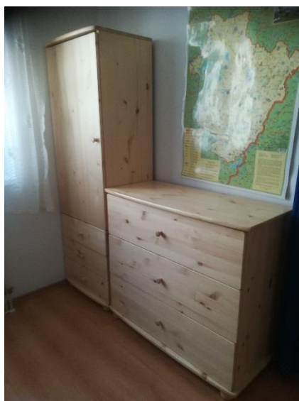
szekrény 1, fiókos komód 1