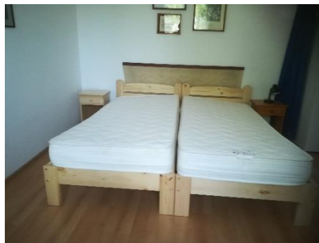
heverő 6, heverő 7, éjjeli szekrény 6