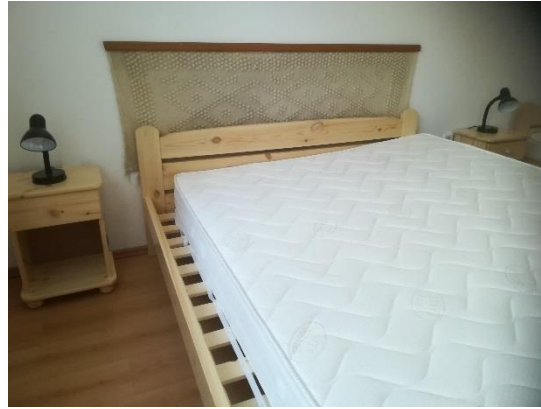
franciaágy 2, éjjeli szekrény 3, éjjeli szekrény 4