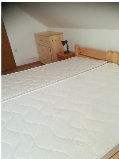
heverő 11, heverő 12