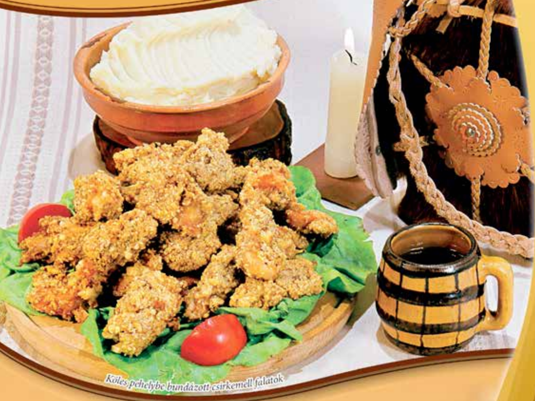
Köles pelyhebe bundázott csirkemell falatok